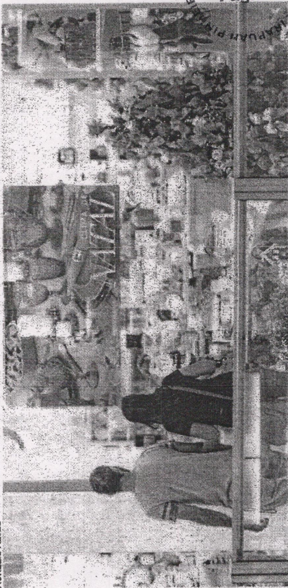
SHOPPINGS de Fortaleza estão otimistas esp. w.f. | apustam nas campanhas promocionais de Natal