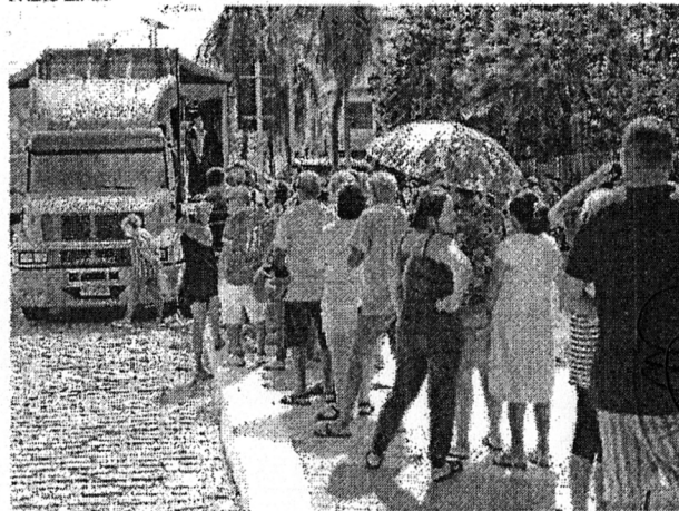
CAMINHÃO Serasa Limpa Nome ficará na Praça José de Alencar até o dia 16