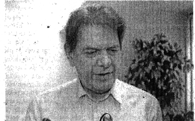
CID GOMES conduziu primeira reunião sob seu comando nesta segunda-feira